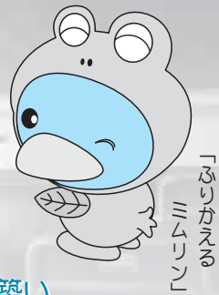
「ふりかえる」 ミムリン